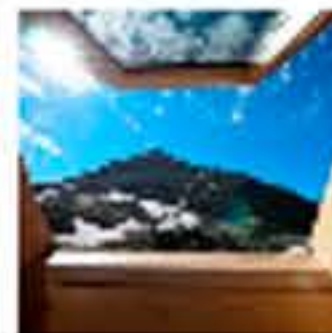
Cap de Lluzet, un refugio de montaña de nueva generación