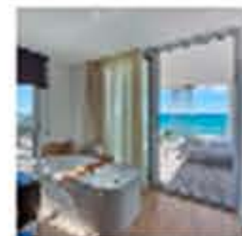
Relajación en Mallorca en el Pure Salt Garonda @Duravit