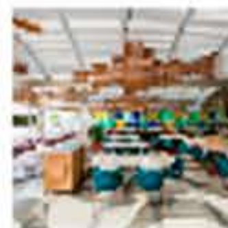
Restaurante Balber: el homenaje de Inniodesign a Mallorca