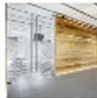
¿Y si la oficina fuera un espacio wellness?