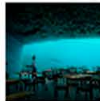
Under de Snaheita, el primer restaurante submarino de Europa

Categoría/s: Hablamos con... | Noticias de la Industria