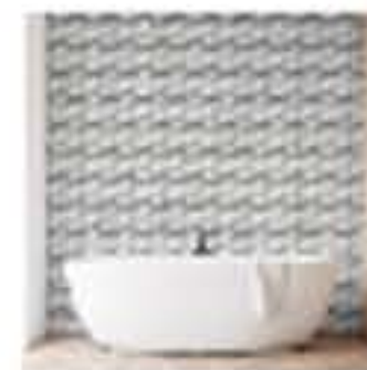
GROSFILLEX presenta ELEMENT 3D #Grosfillex