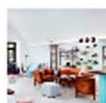
Long Story Short Hotel de Denisa Strmiskova. Diseño de interior para viajeros