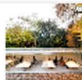
Oficinas donde nos quedaríamos a vivir