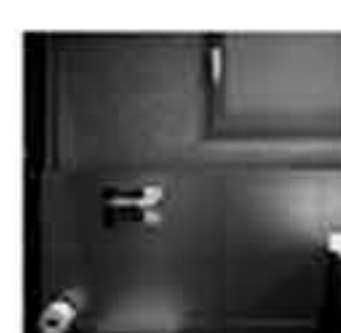
AllBath innova en baños y sanitarios del sector hotelero #AllBath