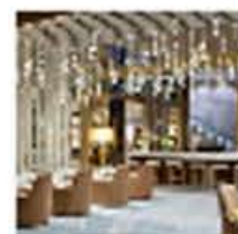
LEDS C4 Ledo-C4 ilumina diferentes espacios del Hotel Palmont Rey Juan Carlos I @ledoc4