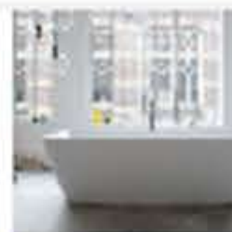
Duravit consigue cuatro premios en los German Design Award @Duravit