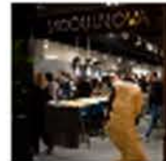
Modulnova: la empresa italiana que apuesta por Barcelona para captar el mercado de alto standing