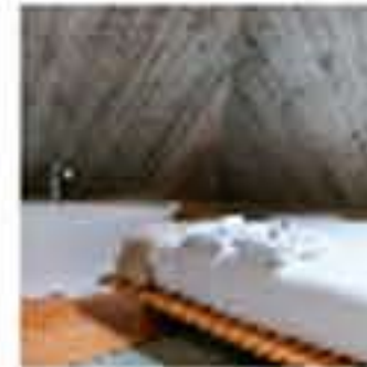
Lo antiguo convertido en nuevo en Força el Amazem Luxury Housing @Duravit