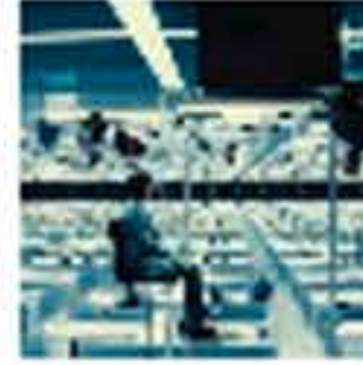
Oficinas. Espacios de trabajo confortables @CriteriaArq