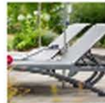
Un momento excepcional con un conjunto de Relax Premium #Grosfillex