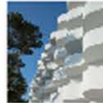
Inturotel Emeralda áreas comunes by Isabel López @PresidLV