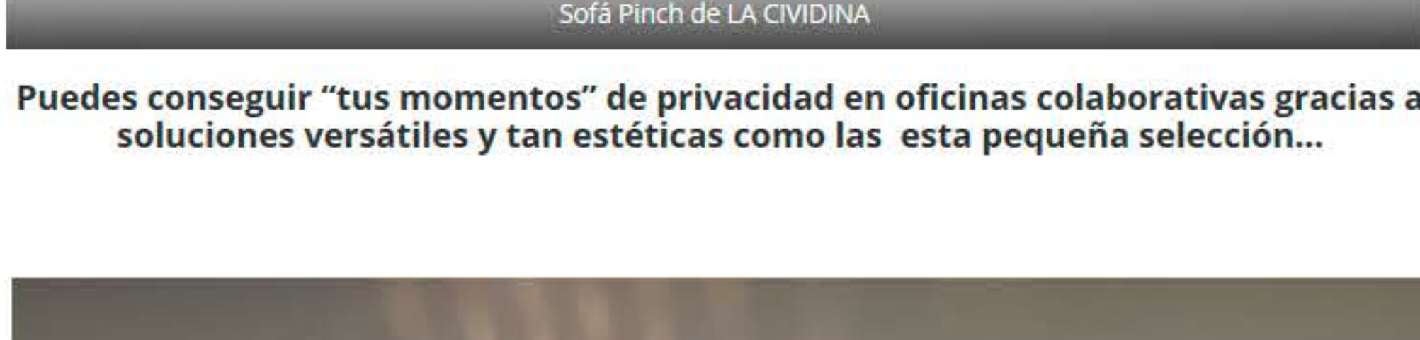
Sofa Pinch de LA CIVIDINA