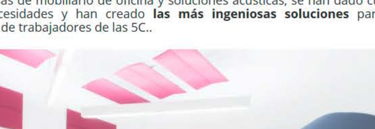
Campana acústica BUZZSHADE

Porqué .. ¿cómo te planteas trabajar cerca de un compañero amante del reggeton o con el que no para de hablar por teléfono?