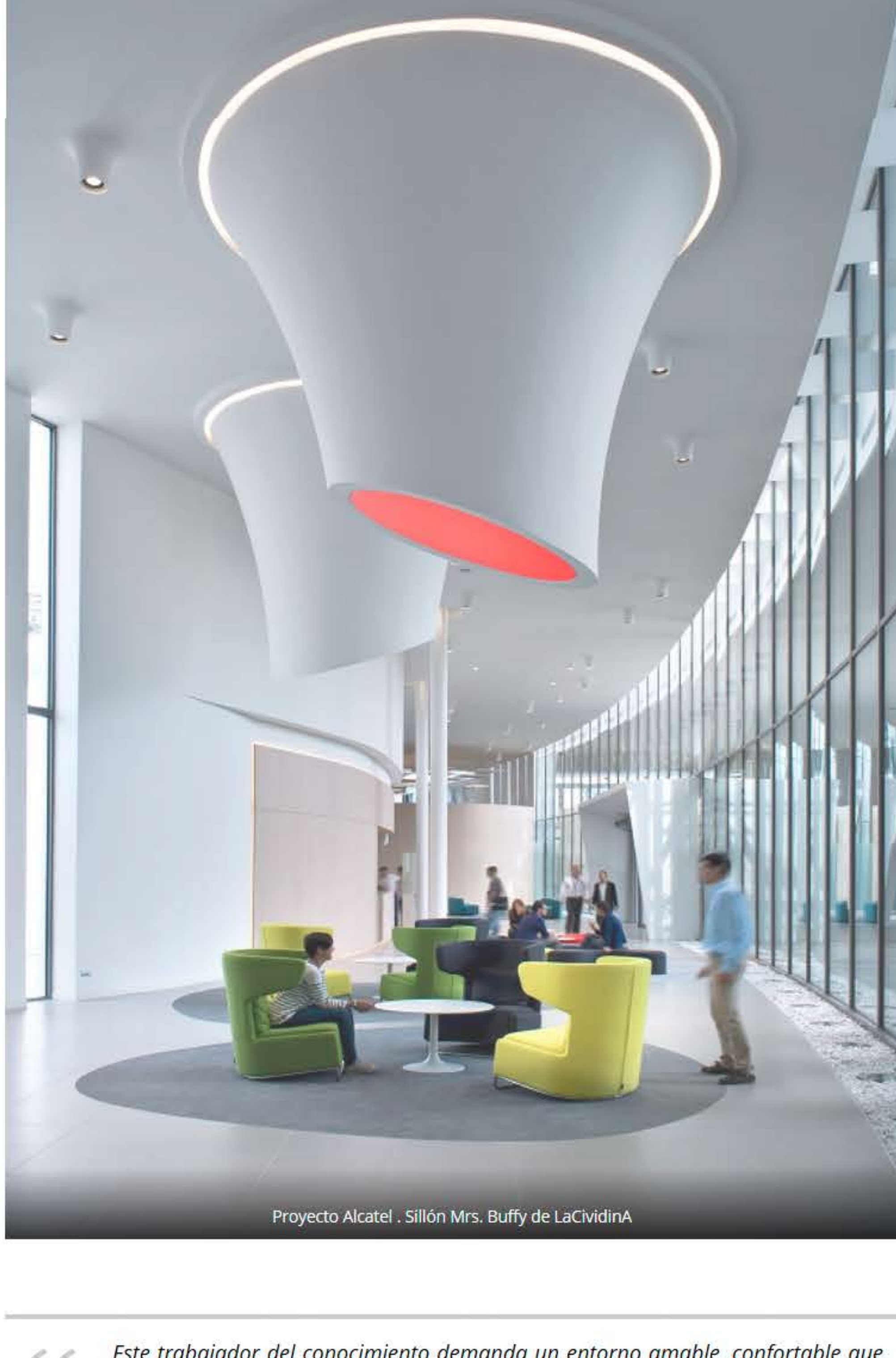
Proyecto Alcatel . Sillón Mrs. Buffy de LaCividina

Nuestra oficina, muchas veces, "está en nuestro bolsillo" y por ello tenemos la posibilidad de optimizar recursos utilizando nuevos conceptos de trabajo en espacios cada vez más colaborativos para que "la transferencia de ideas entre la personas y equipos fluyan de forma inmediata y dinámica y, que a su vez, esas ideas consensuadas y los proyectos que de ellas surjan se puedan ver potenciados por la influencia de otros equipos u otros departamentos dentro de la organización de manera que la riqueza intelectual de la organización crezca."