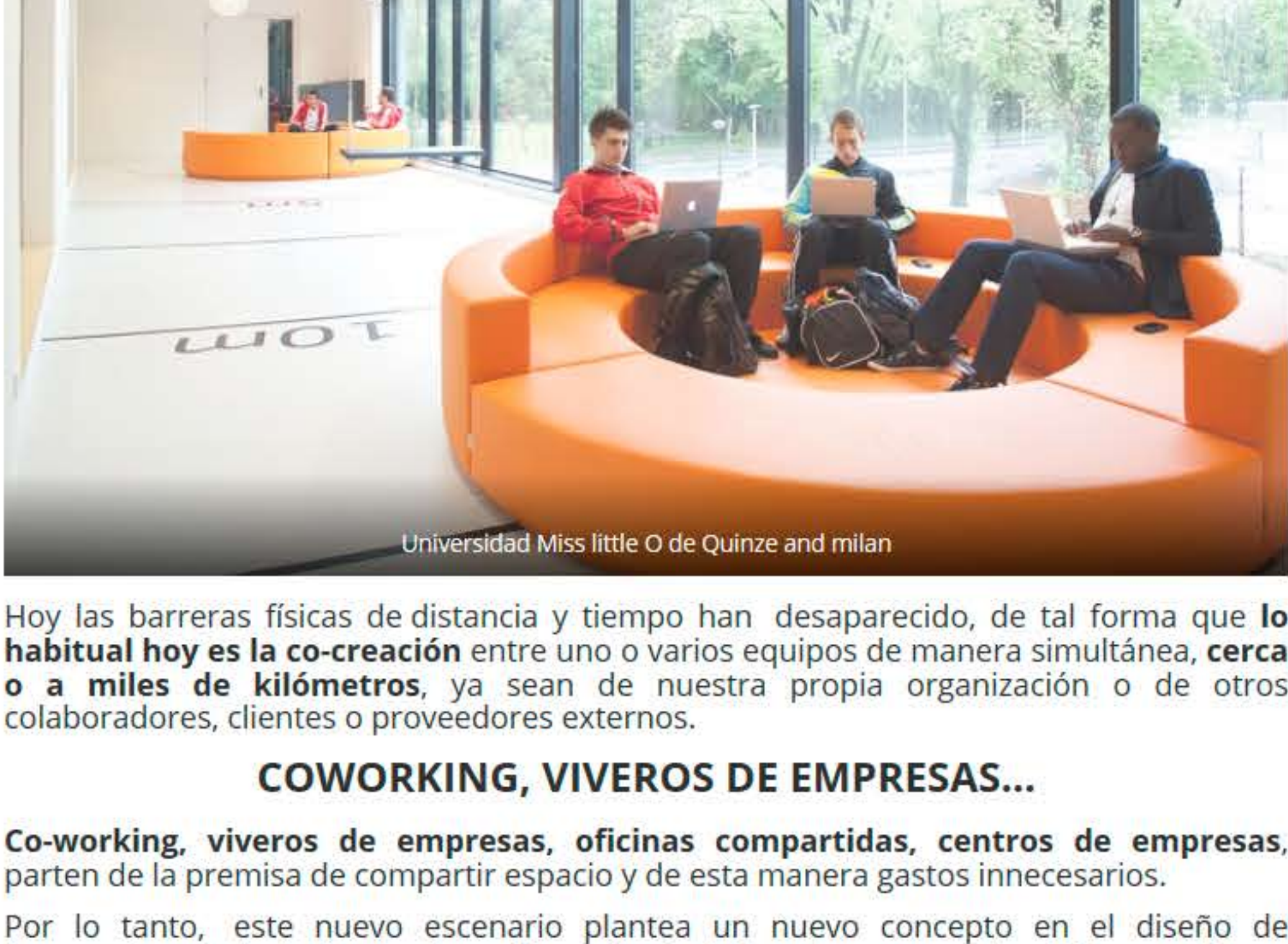
Universidad Miss little O de Quinze and milan

Son las OFICINAS 5.0 , donde co-crear, colaborar, comunicar, compartir y conectar : (las 5 C)