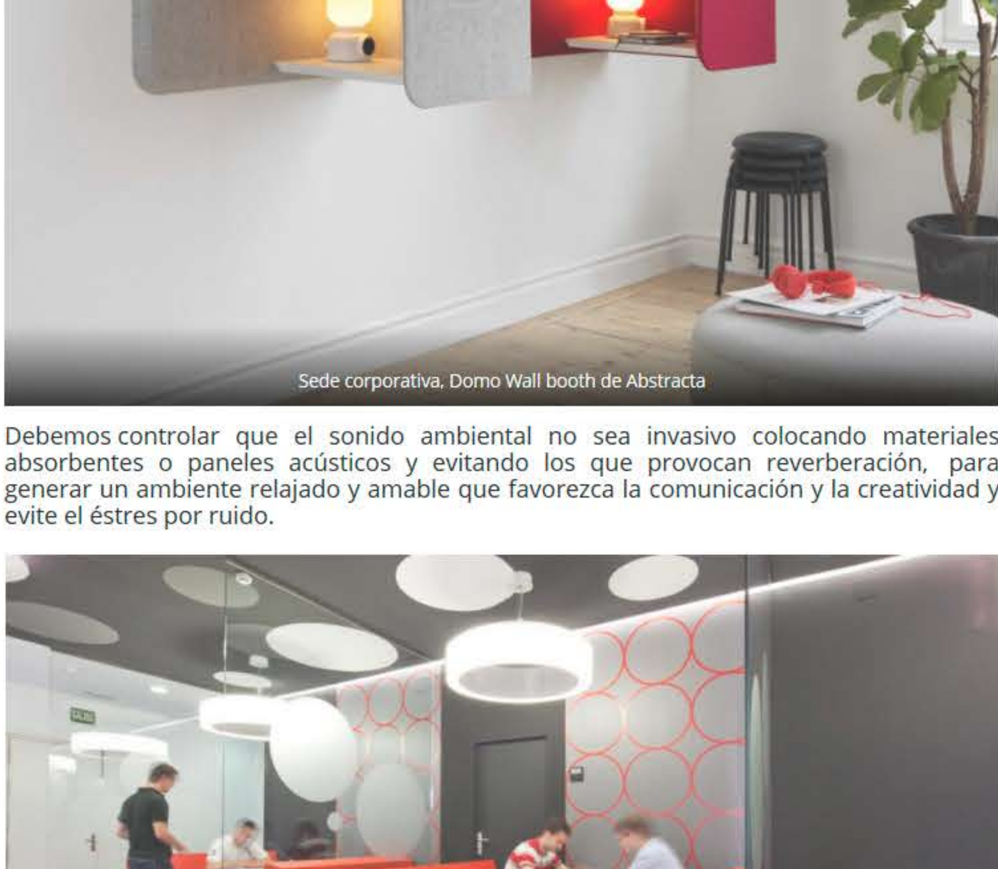
Sede corporativa. Domo Wall booth de Abstracta

Así, hemos podido ver como en los "Open Space" hay siempre lugares adaptados para reuniones , para videoconferencias o simplemente para aislarse del ruido de alrededor.