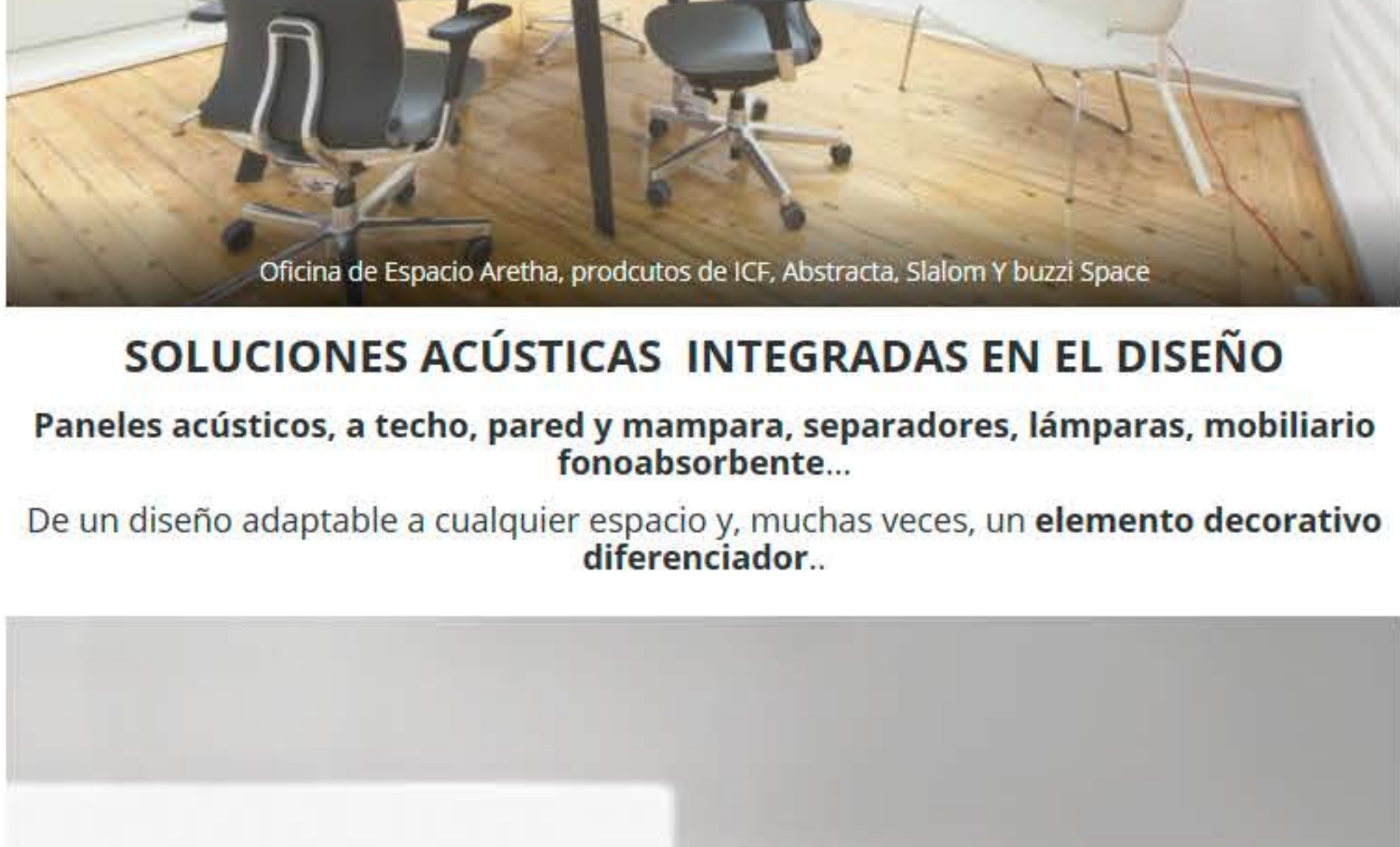
Oficina de Espacio Aretha, productos de ICF, Abstracta, Slalom y buzz Space