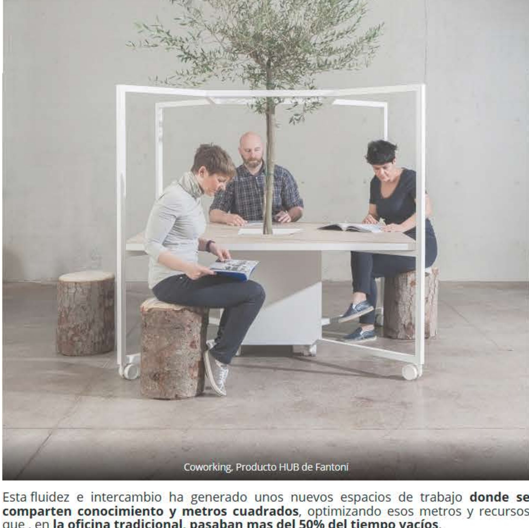
Coworking. Producto HUB de Fantoni

“ Este trabajador del conocimiento demanda un entorno amable, confortable que le permita sentirse en el trabajo como en casa para ser productivo y creativo. Los entornos rígidos no favorecen ni la creatividad ni la comunicación fluida entre personas, equipos y departamentos. Hoy se trata precisamente de hacer que el entorno de trabajo sea un elemento estratégico en la atracción, potenciación y retención del talento que tanto cuesta detectar para las organizaciones, talento que debe ser la herramienta básica para crear equipos de alto rendimiento que puedan alinearse con los objetivos corporativos y la misión de la empresa en el largo plazo.